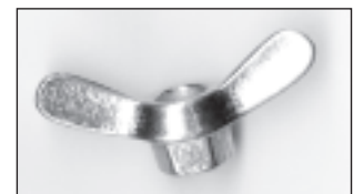
Flügelmutter mit zusätzlichem Außensechskant.