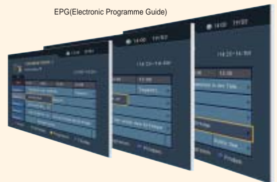
EPG(Electronic Programme Guide)